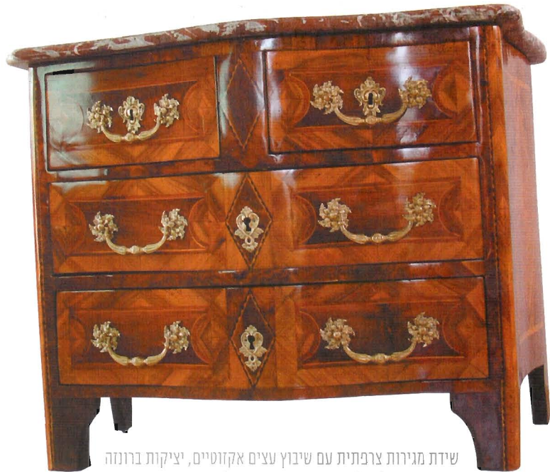
שידת מגירות צרפתית עם שיבוץ עצים אקזוטיים, יציקות ברונזה ומשטח שיש למעלה. מאה ה-19. ירמי זלטנד

מטרת השימור של עיר או חלקיה היא ליצור סביבה עשירה ואיכותית שמכילה שכבות מהעבר לצד חידושים מההווה, ליצור הרכב עיצובי מעניין וחזויתי שייתן ביטוי פיזי לזהות המקומית, ולעזור לתושבים למקם את עצמם בסביבה המיידית בה הם חיים. שימור עירוני הוא מכלול פעולות שמטרתן להבטיח המשך קיום תקין ושלם של המבנים והאתרים המיועדים, בהן: הגנה על המבנה, תחזוקה, ייצוב, שימור הקיים, שיחזור ושיקום וגם בנייה מחדש על סמך