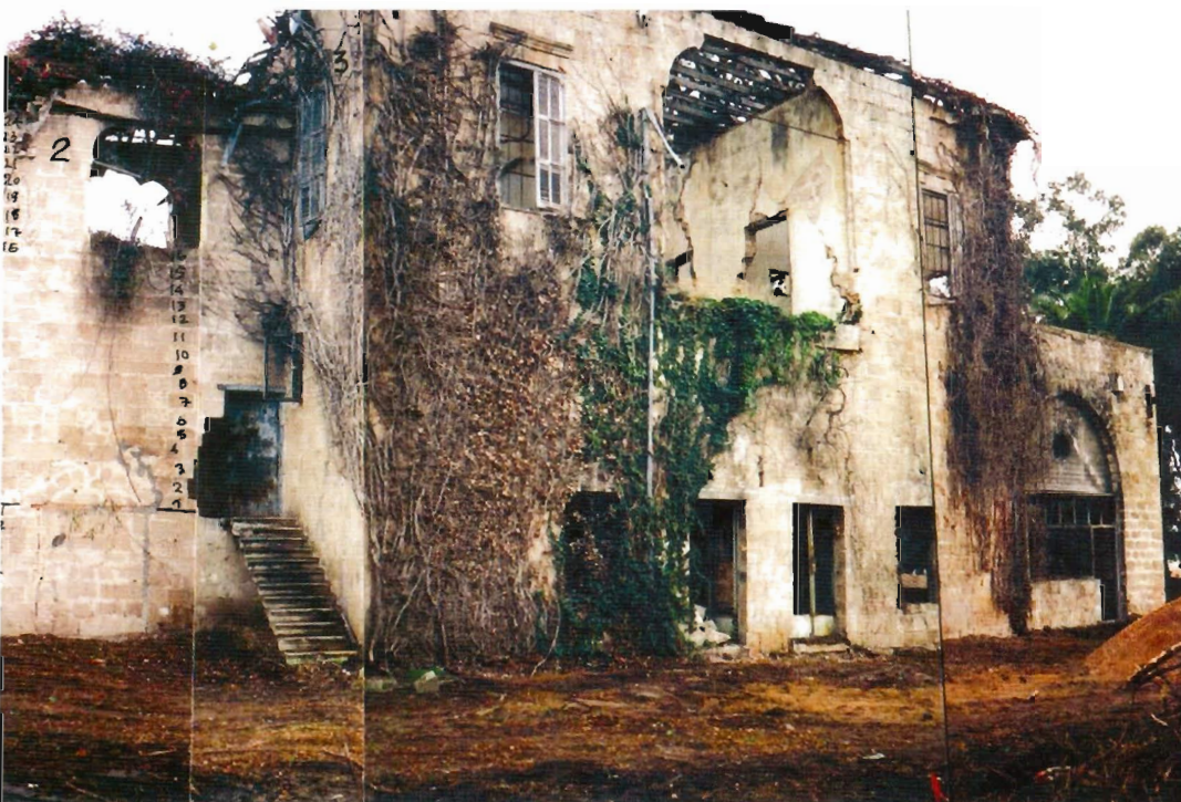
בית ליברמן, נהריה לפני הרסטורציה ואחריה. המועצה לשימור אתרים