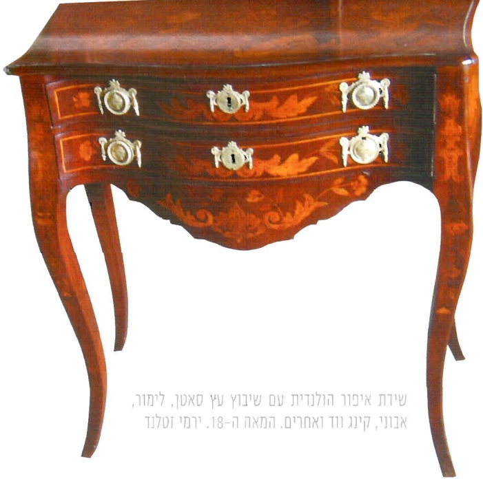
שידת איפור הולנדית עם שיבוץ עץ סאטן, לימור, אבוני, קינג ווד ואחרים. המאה ה-18.